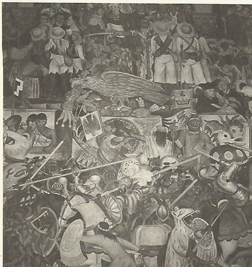
Fotografía: Luis Barrón / Mural Palacio Nacional

Biografía de Ignacio Comonfort [En línea] ( http://omnibiografia.com/biografias/biografia.php?id=47 )